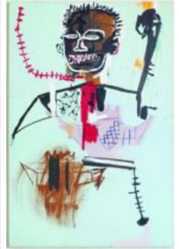
Trois œuvres appartenant à la collection privée d'Edouard Carmignac : de gauche à droite, Portrait de Lénine , par Andy Warhol ; Village de pêcheurs , par Roy Lichtenstein ; Portrait d'Edouard Carmignac , par Jean-Michel Basquiat.