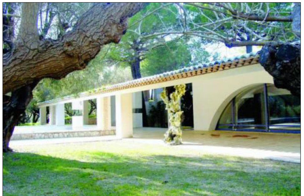
Edouard Carmignac est le nouveau propriétaire de cette grande maison et de son superbe parc. Le collectionneur va bientôt « offrir » à l'île une Fondation d'art contemporain.