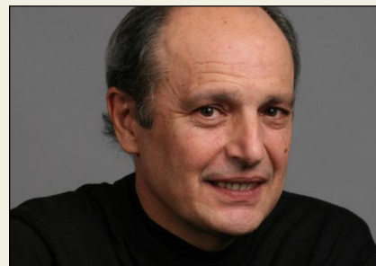
Marc Barani sera chargé de la transformation intérieure de la Courtade

L'architecte niçois connu notamment pour avoir reçu, en 2008, le Prix de l'Équerre d'argent pour la réalisation du pôle multimodal du tramway de Nice sera donc chargé de faire de la Bastide de La Courtade un musée d'art contemporain. Il dévoile ici pour Var-matin , sa vision du futur musée : « Le projet s'installe sous les bâtiments existants, pour laisser intacte leur silhouette dans le site. Seuls quelques plans d'eau à même le sol fournissent les indices d'une